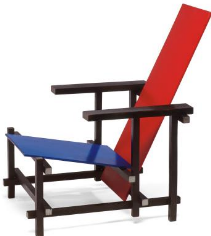
Rietveld, Rood-Blauwe stoel , 1923, Stedelijk Museum Amsterdam

Van der Leek wilde zijn kunst niet apart zien van de ruimte waarin ze gezien werd. Net als de andere kunstenaars van De Stijl streefde hij ernaar dat de toeschouwer zijn werk beleefde in harmonie met de omgeving. Veel van zijn werk bestaat uit wandschilderingen, tapijten en andere toegepaste kunst. In 1916 leert hij Mondriaan kennen en verandert zijn stijl. Voor deze ontmoeting was zijn stijl al opvallend naïef, maar na de ontmoeting met Mondriaan abstraheert hij nog sterker. Ook gaan zijn schilderijen opeens 'composities' heten. De schilderijen van Van der Leek worden bijna nooit helemaal abstract. Hoewel ze strikt genomen ook beperkt zijn tot geometrische vormen en basiskleuren, de voorstelling is vaak nog goed terug te leiden tot iets herkenbaars. Zo blijft de werkelijkheid altijd een uitgangspunt.