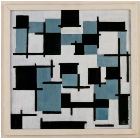
Van Doesburg, Compositie XIII , 1918, Stedelijk Museum Amsterdam